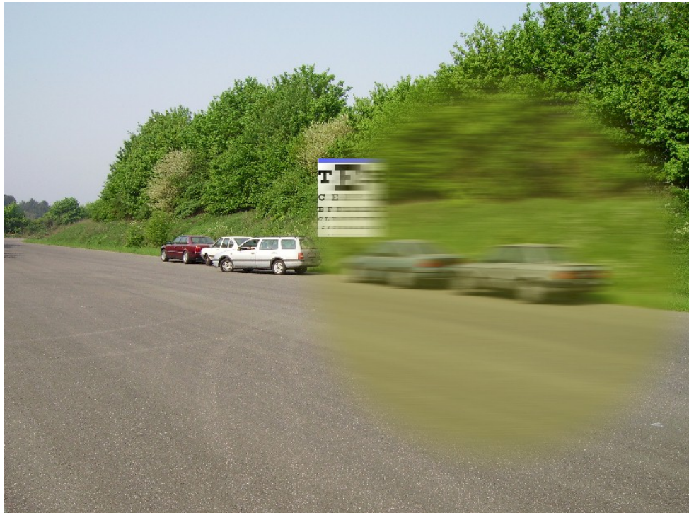
Billede 1 simulering af katarakt